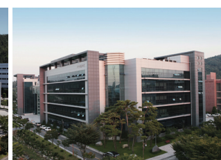
知识信息馆(研究生院)