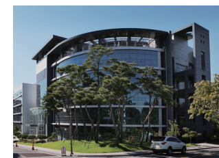
知识信息馆(产学合作馆)