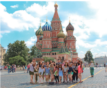
国际专业体验(国立莫斯科大学)