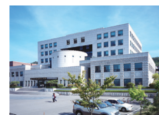
星岩纪念中央图书馆