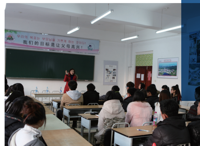
中国国际交流协力中心 - 东北 地址：中国黑龙江省牡丹江市西安区温春镇 黑龙江农业经济职业学院 (1817号) 联系方式：070 4323 3437

本校在国外设立南首尔大学国际协力中心(ICC)，在当地进行外国留学生招生宣传、韩语授课、韩国文化课程等，为当地留学生方便、快捷地提供本校信息，为韩流文化的传播做贡献。国际交流协力中心(ICC)除了进行韩语教育之外，还指导希望到本校留学的学生准备所需材料，帮助他们办理签证等业务，使学生们以低廉的费用便捷地申请南首尔大学。国际交流协力中心(ICC)分别在中国黑龙江设立东北ICC，在越南河内设立河内ICC。当地专家和韩国派遣的韩语讲师共同授课，优秀的留学生通过ICC到南首尔大学留学。通过国际交流协力中心不仅可以确保留学生招生的安全性，还可以提高留学后的适应能力，学生们通过成功的留学，直到毕业后就业都可以得到保障。