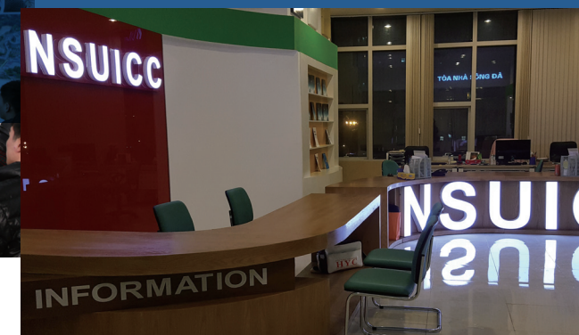
越南国际交流协力中心 - 河内 地址：7 Floor, 290 Nguyen Trai Street, Trung Van, South Tu Liem, Hanoi 联系方式：+84 4 3787 8911