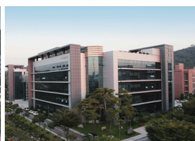
知识信息馆(研究生院)