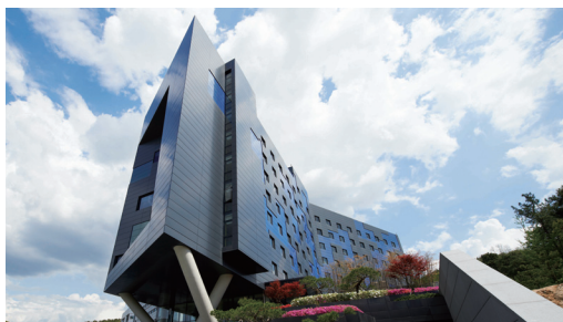
宿舍全景(一馆、二馆)