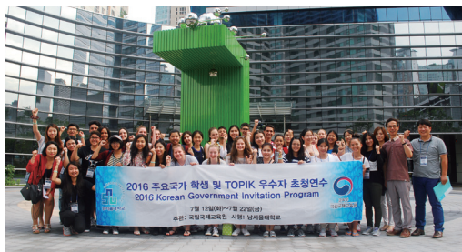
主要国家邀请研修