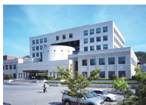
星岩纪念中央图书馆