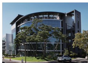
知识信息馆(产学合作馆)