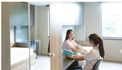
宿舍内部(二馆二人间)